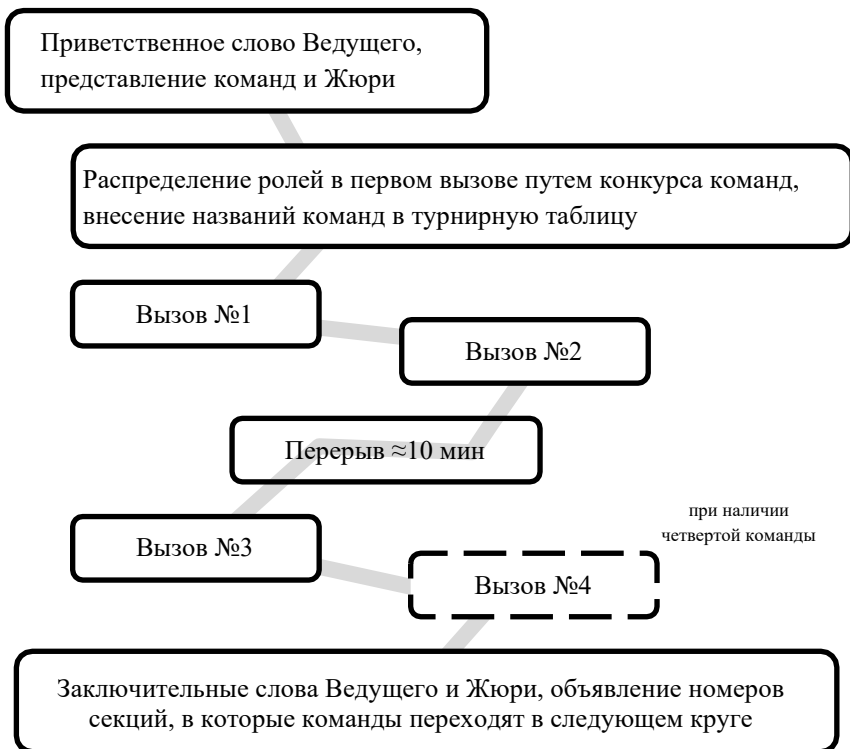
Схема игрового круга